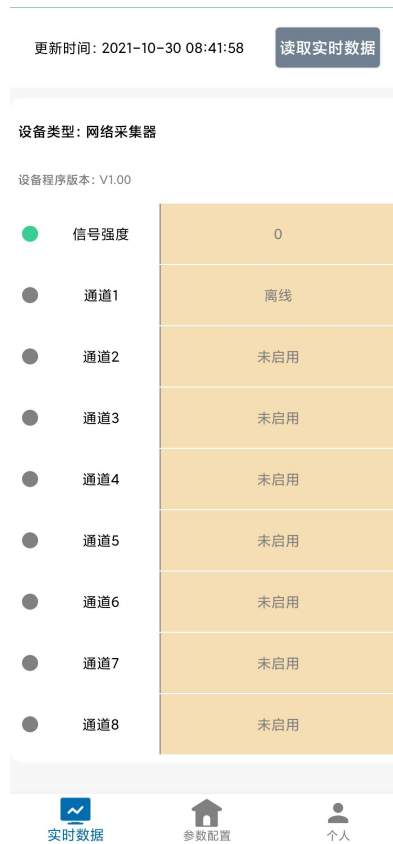
● 节点 1-8: 节点对应数据如下表